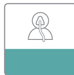
Mijn instellingen icoon

Ga met de draaiknop van uw CPAP-apparaat in het menu naar het 'mijn instellingen'-icoon, klik op de knop.